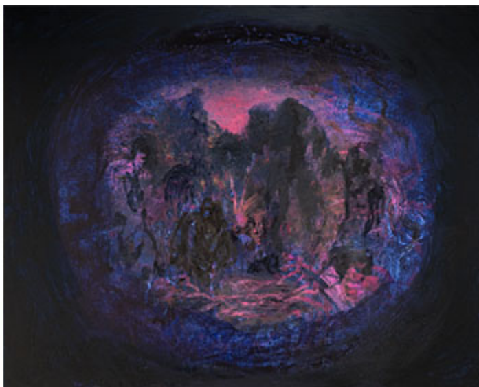
© Martin Ålund (klicka på respektive bild för hög upplösning)

Det är intressant att ta del av bakgrunden till Martin Ålunds aktuella utställningar på Konstakademien och Galleri Flach. Som en av Konstakademiens vistelsestipendiater i Paris år 2018 genomgick han en konstnärlig metamorfos i ateljén. Han drabbades av ett alter ego som tog kropp i honom och lät penslarna och kolet dansa på en lång utandning. De kollegiala samtalen utvecklades lika självklara som Swedenborgs parallella i andevärlden.