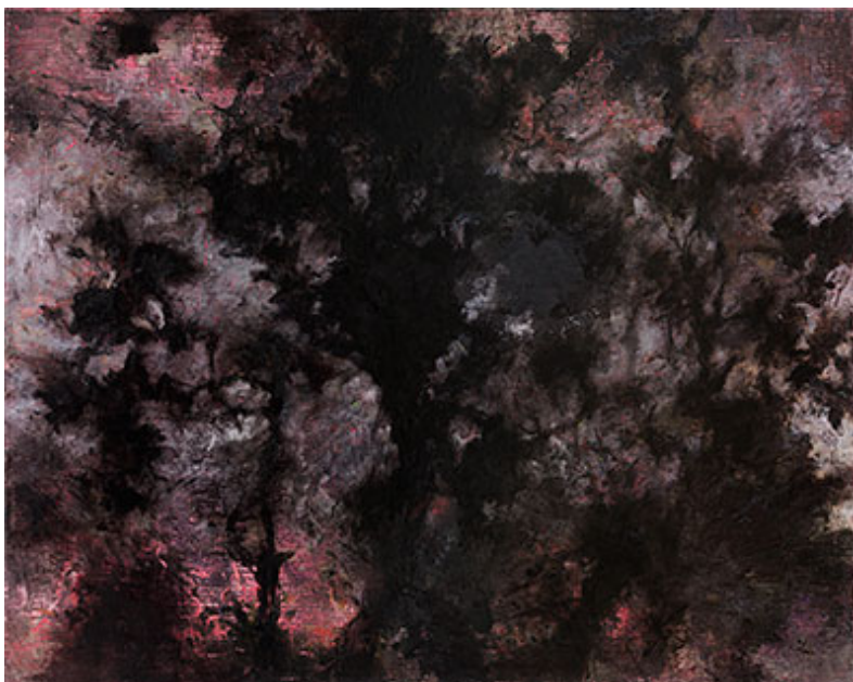
"Chemistry II:IX", 2015, opd, 80x100 cm © Martin Ålund.

Men något avgörande har skett. Martin Ålund beskriver det som att måleriet sökte upp honom, att han inte riktigt kunde värja sig. Floder av färg låter sig inte sakligt argumenteras bort.