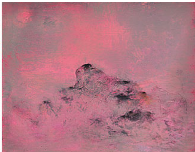
"Chemistry III", 2014, opd, 110x140 cm © Martin Ålund. Foto Helena Björk

Glipor, rinningar , krackeleringar och öar av intorkad färg – det finns ett notoriskt drag av alkemi över Martin Ålunds nya målningar. Av undersökningar som närmar sig de bortre regionerna för vad oljefärgen rent blandningstekniskt kan låna sig till. Som om Martin Ålund velat tvinga ur själva "anden" ur materialet. Det handlar naturligtvis inte om att utvinna guld, men väl om att närma sig guldets positionella motsvarighet på den visuella sidan.