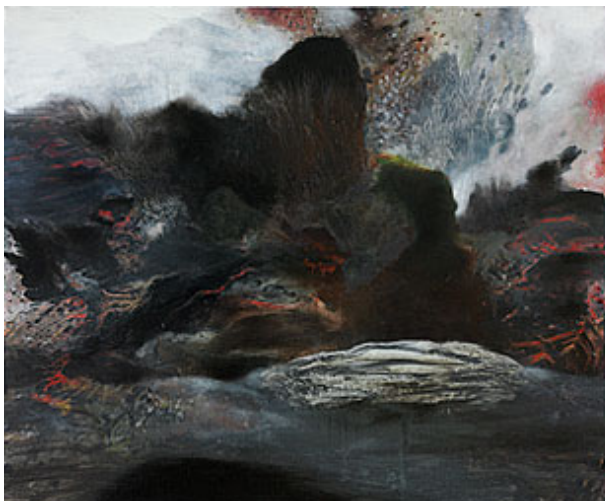
"Chemistry II", 2014, opd, 100x120 cm © Martin Ålund. Foto Helena Björk