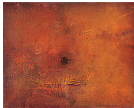
"Chemistry III:I", 2014, opp, 80x100 cm © Martin Ålund.