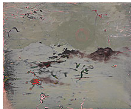
"Chemistry V:VI", 2015, opd, 29x35 cm © Martin Ålund.

Distans, nedtoning och målerisk nyansering har annars tidigare varit något av Martin Ålund signum, gärna med en viss tidstypisk ironisk krydda; små människofigurer, eller då och då någon folkabuss, har dykt upp ur de varsamt frammejslade, tunna färggridåerna.