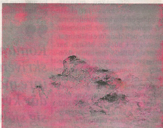
Målningar ur sviten "Chemistry" av Martin Ålund. FOTO: MARTIN ÅLUND